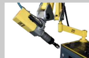
Schneiden unter jedem Winkel