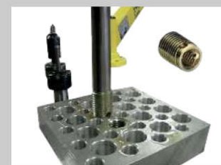
Eindrehen von Inserts