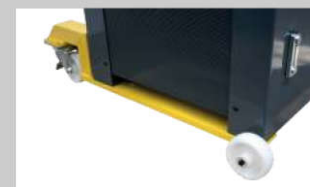
Laufrollen für alle Maschinen