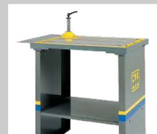
Gusstisch für pneumatische Maschinen und GH 18