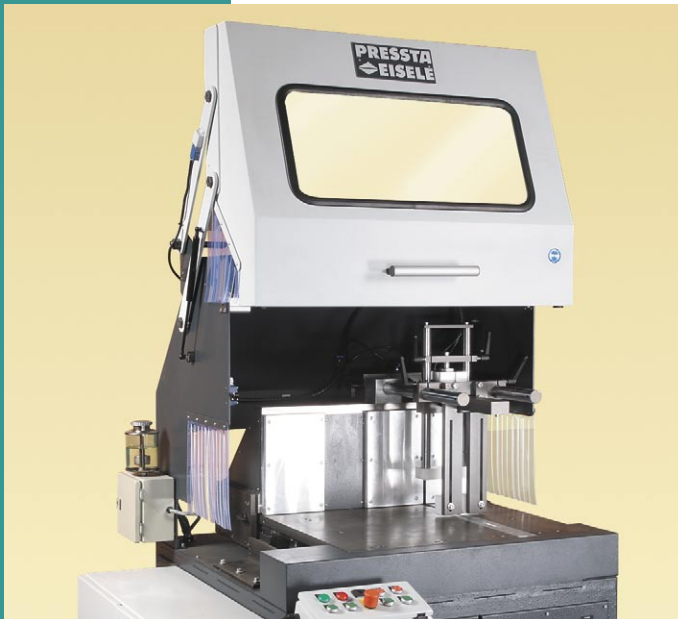
GS 700 Fix, das Kraftpaket