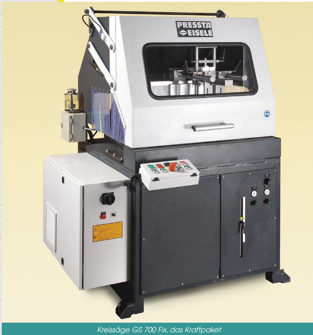
Kreissäge GS 700 Fix, das Kraftpaket